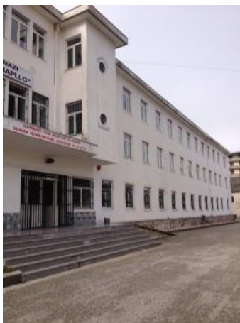
Pamje e përgjithshme