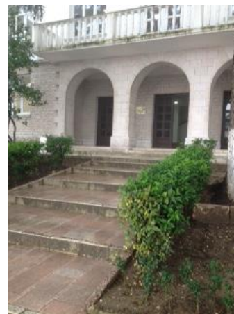
Godina kryesore e bashkisë