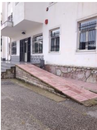
Hyrja dhe rampa

Gjetje dhe rekomandime për aksesin në hyrje dhe nivelin bazë të përshtatshmërisë së objektit: Hyrja kryesore e shkollës arrihet me 6 bazamakë shkallësh të jashtme 15cm x 30cm. Përbri saj është vendosur një plan i pjerrët për të lehtësuar aksesin për nxënësit PAK që lëvizin me karrigen më rrota. Rampa ka gjatësi 530cm dhe gjerësi 110cm, ndërkohë që sipas standartit duhet të jetë më gjatësi 1250cm, përshi një sheshpushimi në mes të saj. Gjerësia e rampës duhet të jetë 120cm dhe rampa duhet të jetë e paisur me parmakë dhe me shirita orientues në fillim dhe mbarim të pjerrësisë për lehtësi të lëvizjes për PAK që nuk shikojnë ose shikojnë me shumë vështirësi. Dera e hyrjes është me dy kanata nga 70cm dhe hapet nga brenda, ndërkohë që standarti e kërkon të hapet nga jashtë dhe të jetë lehtësisht e manovrueshme nga PAK.