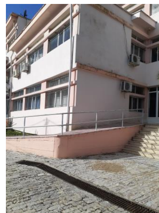
Fakulteti i letërsi/Ekonomi

Më tej ka dy grupe me nga 8 bazamakë secili prej 18cm x 35cm, dhe në fund një grup me 9 bazamakë prej 18cm x 35cm. me të cilin arrihet në sheshin para hyrjes kryesore. Mbas këtij korpusi ndodhet korpusi 2 kat i fakultetit të shkencave/matematikës i cili