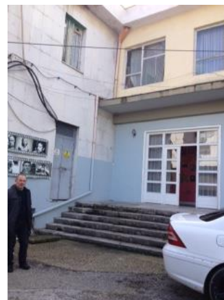
Hyrja direkt në sale

Vendosja e rampës nga rruga publike përbri shkallës në hyrjen kryesore, ndonëse ajo është një shkallë shumë e gjerë, do të kërkonte një sipërfaqe të konsiderueshme.