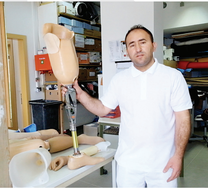
Ky material është përgatitur nga Fondacioni Shqiptar për të Drejtat e Personave me Aftësi të Kufizuara (FShDPAK), në kuadër të Programit të Përbashkët të Kombeve të Bashkuara "Askush të Mos Mbetet Pas/Leave No One Behind" (LNB), i cili zbatohet në bashkëpunim me Qeverinë Shqiptare dhe mbështetet nga Agjencia Zvicerane për Zhvillim dhe Bashkëpunim (SDC).

Shërbimi i protezimit, ortezimit, rehabilitimit të personave me aftësi të kufizuara ofrohet çdo 3 (tre) vjet për personat me aftësi të kufizuara dhe përfshin prodhimin e protezave për gjymtyrët e sipërme dhe të poshtme, orteza për deformimin e këmbëve dhe shtyllës kurrizore, rehabilitim të personave që kanë bërë amputim, si edhe trajtim psikologjik për personat me aftësi të kufizuara duke i motivuar që të integrohen në shoqëri.