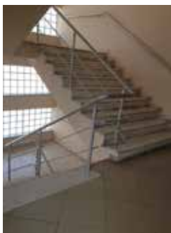
Shkallët e brendshme