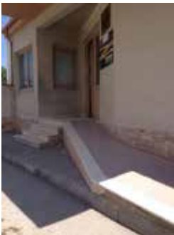
Hyrja në sallën e pritjes

Funksionet kryesore në shërbim të publikut kryhen nga ZShQ, pranë Komisarariatit të Policisë Korçë, në një godinë 1 kat. ZShQ aksesohet për publikun direkt nga rruga publike dhe nga oborri i brendshëm i institucionit. Hyrja nga rruga publike arrihet me shkallë të jashtme të përbërë nga 4 ngjitje [16cm x 30cm] si edhe me një rampë përbri saj, e cila ndjek konturin e murit të jashtëm të ndërtesës. Rampa fillon mbi trotuarin e rrugës publike i cili ka lartësi 20cm mbi kutotën e rrugës dhe lidhet me sheshpushimin e shkallës së jashtme. Rampa është me gjatësi totale 348 cm dhe përbëhet nga dy pjesë [272cm + 76cm] të cilat bashkohen në kënd të gjerë. Të dy pjesët e rampës kanë gjerësi