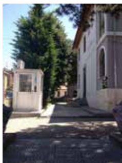
Drejtoria e Policisë Rrugore

Pranë Drejtorisë Vendore të Policisë së Qarkut Korçë funksionojnë [i] Komisarjati i Policisë Korçë dhe ZShQ, ndërtesë 1-katëshe [kati përdhe]; [ii] Komisarjati i Policisë Maliq [shërbimet ofrohen tek ZSHQ Korçë]; [iii] Komisarjati i Policisë Pogradec, ndërtesë