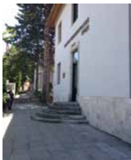
Drejtoria Vendore e Policisë