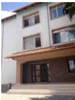
Komisarijati, Godina 3 kat