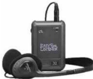
Figura [2] 17

Pajisja ndihmëse e dëgjimit (“ALD”) 16 [figura 2] duhet të sigurohet në të gjitha sallat ku zhvillohen takimet apo ofrohen shërbimet për publikun. Pajisjet ndihmëse të dëgjimit mund të jenë të lëvizshme apo të instalohen për përdorim nga PAK dhe në çdo rast që kërkohet duhet të ofrohen nga stafi i institucionit.