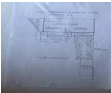
Rampat, R-1 dhe R-2 Rampa, R-3