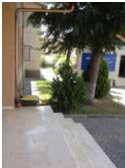
Pamje nga oborri i institucionit