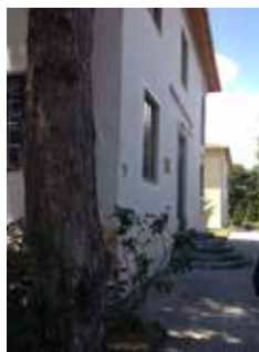
Drejtoria Vendore e Policisë